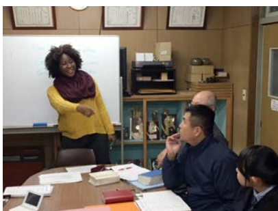
明るいヨネイさんが授業を盛り上げます

（タナーさん）それに、病気になったりけがをしたりすると、やはり言葉の問題で苦労しますね。